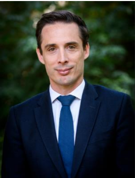
Jean-Baptiste Djebbari Ministre délégué auprès de la ministre de la Transition écologique, chargé des Transports

Le Gouvernement mobilise à travers une série de 16 mesures près de 1,7 milliard d'euros pour accompagner la transition environnementale de la filière logistique française et en faire un levier puissant du plan de relance.