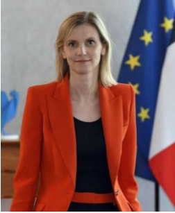
Agnès Pannier-Runacher Ministre déléguée auprès du ministre de l'Économie, des Finances et de la Relance, chargée de l'Industrie