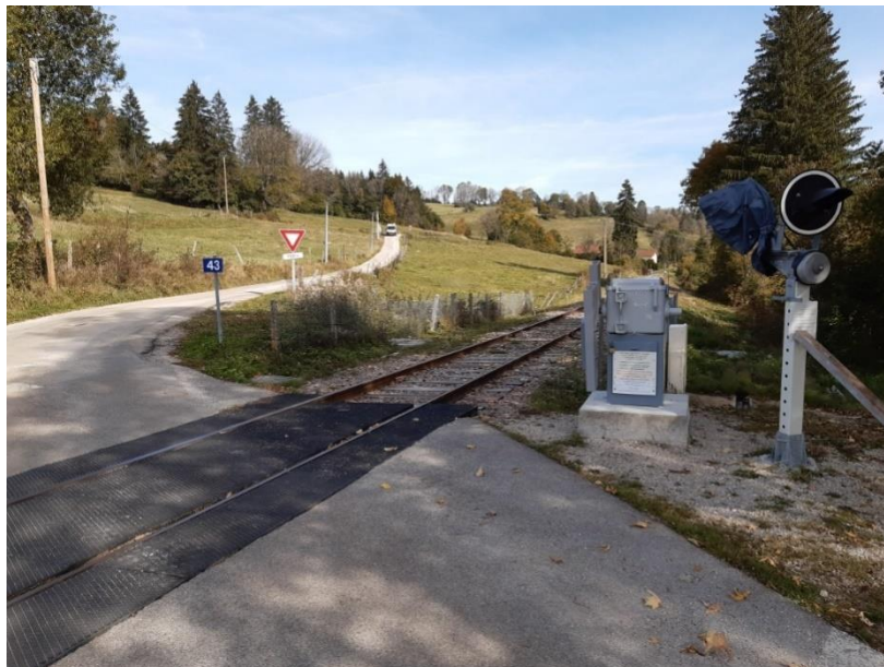
Passage à niveau n°43 : Les Combes

En complément, le passage à niveau n°24 sur la commune d'Epenoy, et le passage à niveau n°43 sur la commune de Les Combes ont été automatisés. Ces nouveaux aménagements permettent de renforcer la sécurité sur ces passages à niveau et d'améliorer le confort des usagers lors de la traversée du passage à niveau. Ce chantier a représenté un investissement d'environ 280 000 €.