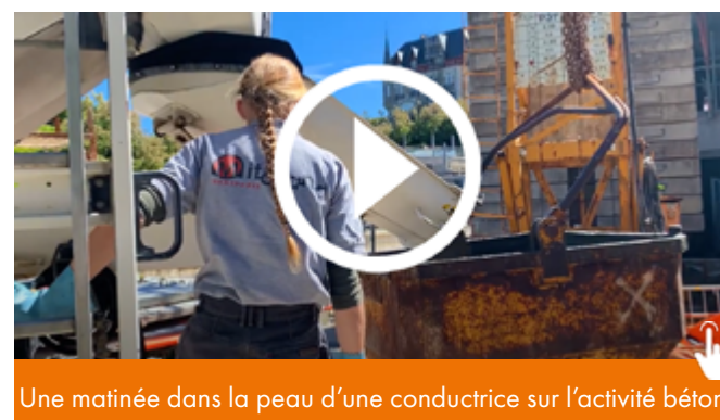
Une matinée dans la peau d'une conductrice sur l'activité béton