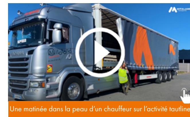
Une matinée dans la peau d'un chauffeur sur l'activité tautliner

Ma fille Emma fait des études de communication et quand elle est venue en stage dans l'entreprise, on lui a proposé d'accompagner les chauffeurs sur leur tournée pour pouvoir faire des petites vidéos afin de faire découvrir les différentes activités proposées par l'entreprise sur le terrain. En effet, entre décrire le métier et voir les images, l'approche est différente... d'ailleurs, nous avons eu plein de retours positifs suite à ces publications. L'image a plus d'impact dans l'esprit des gens. A travers ces petites vidéos, on souhaite aussi faire découvrir aux jeunes ce métier, redorer l'image du transport qui a bien évolué sur les conditions de travail pour attirer de nouveaux talents... de nouveaux « Mitalanders » !