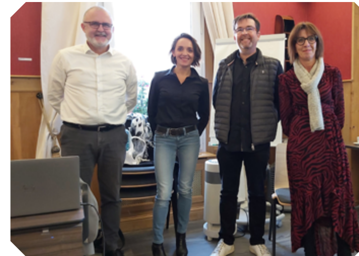
De gauche à droite :

Représentatif des différentes spécialités du transport et de la logistique pour intervenir sur les champs de l'emploi et de la formation professionnelle, le CRFPTL est l'expression de la volonté des entreprises et des fédérations professionnelles.