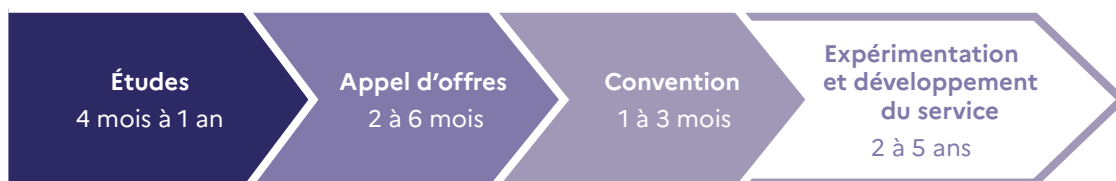
Étapes de déploiement d'un service d'autopartage dans le cas d'une gestion confiée à un opérateur

Il est notamment intéressant que le contrat entre la collectivité et l'opérateur permette une certaine souplesse pour ajuster le service après une première période de test, en fonction des retours usagers et de l'utilisation des véhicules. Il est également intéressant de prévoir des modalités de remontée de données sur l'utilisation du service (taux d'utilisation, durée et distance des trajets, profils des utilisateurs, etc.) voire de prévoir des enquêtes auprès des usagers.