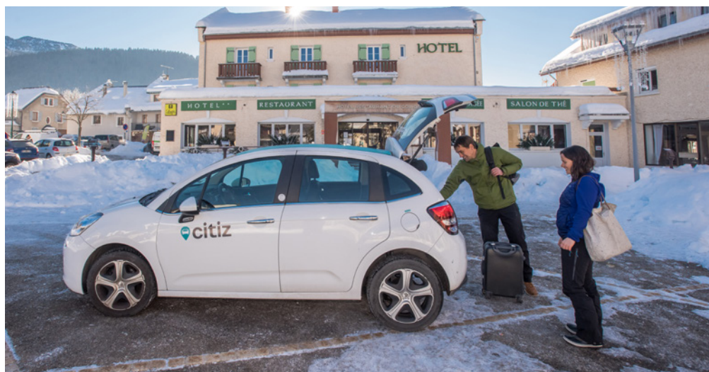
Véhicule destiné à l'autopartage