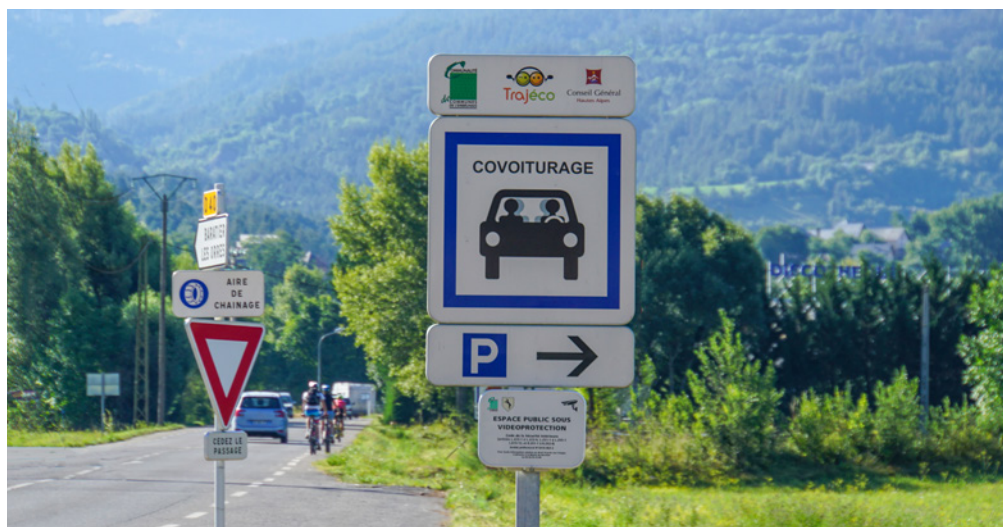
Accès à l'aire de covoiturage de l'Embrunais