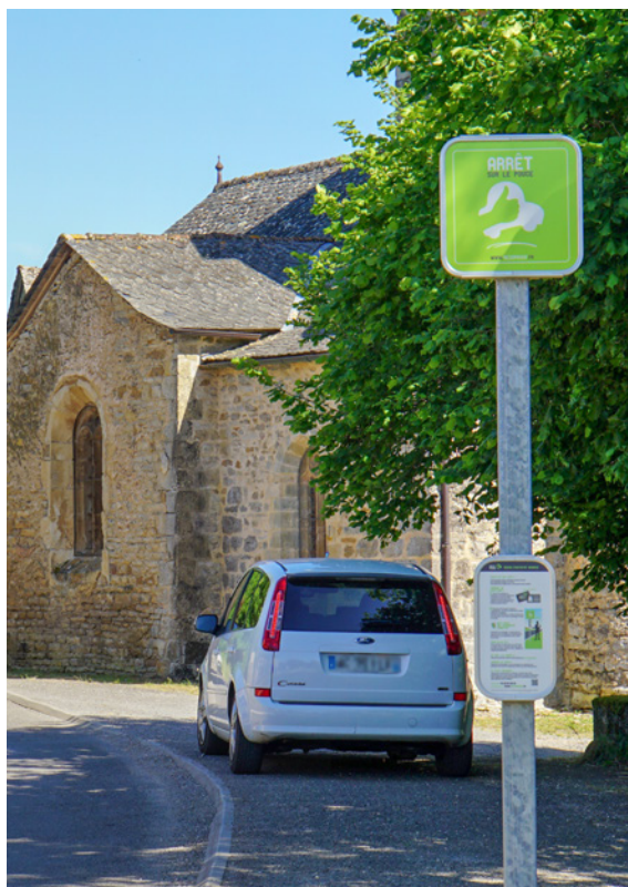
Point d'arrêt d'autostop organisé (Rezopouce) dans un village

Les choix à opérer sur ces différents axes de travail dépendront alors :