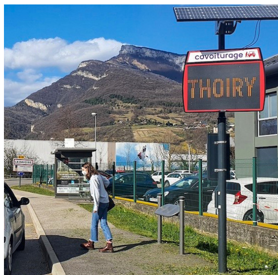
Arrêt de covoiturage avec sa signalisation verticale

Le site et l'application de covoiturage du quotidien Mov'Ici, mis en œuvre par la région Auvergne Rhône Alpes et l'application BlablaCar Daily avec une campagne d'incitation financière portée par l'AOM, complètent l'offre de covoiturage du territoire.