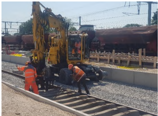
Repose de la voie