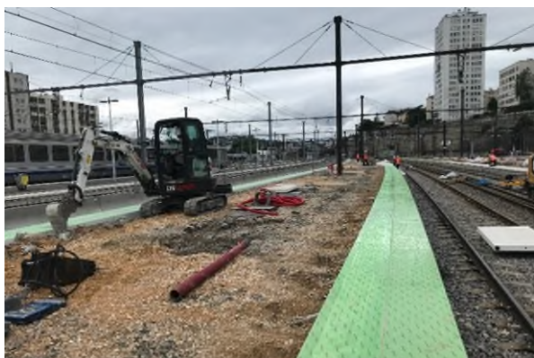
Mise en place des dalles podotactiles