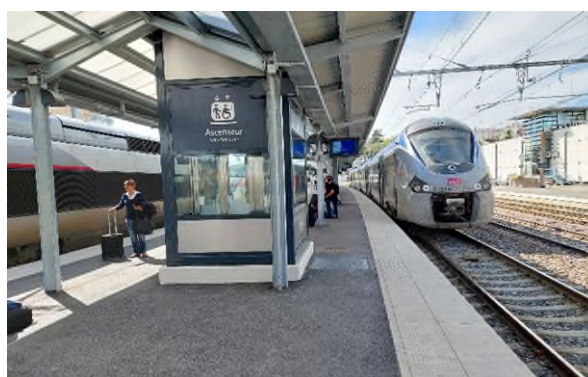
Aménagement des quais après travaux