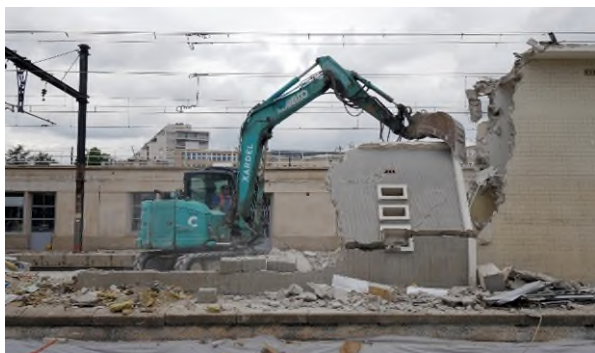
Démolition du bâtiment sur le quai 2