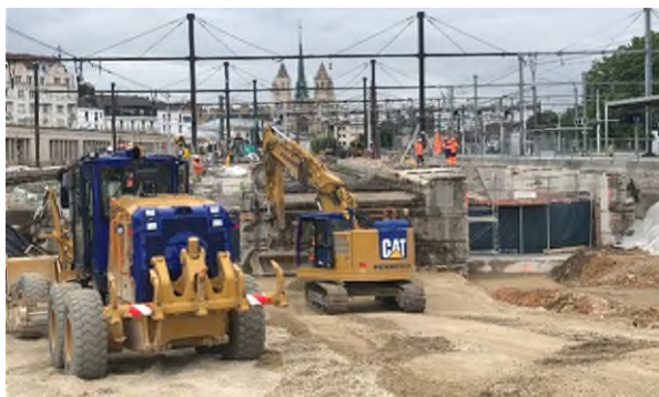
Travaux de terrassement pour la création de la rampe d'accès