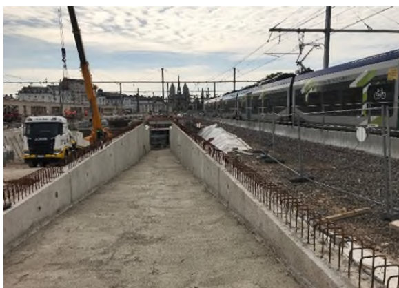
Construction de la rampe d'accès