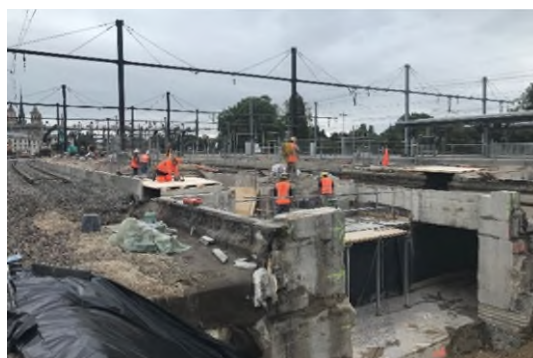
Travaux de terrassement de génie civil