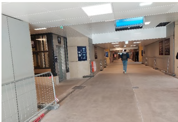
Aménagement du souterrain