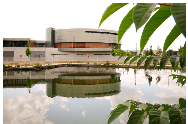
La Commande Centralisée du Réseau à Dijon

Pour conclure, si nos habitudes de travail ont changé dans les postures, notre priorité permanente, elle, n'a pas changé : nous continuons à faire circuler les trains en toute sécurité, et nous traitons les incidents exactement de la même façon qu'avant le COVID-19. La différence est que l'organisation a été optimisée de façon à permettre à un maximum d'agents de rester chez eux en alternance pendant que d'autres continuent d'assurer le service minimum tout en assurant les circulations ferroviaires dans des conditions de sécurité optimales.