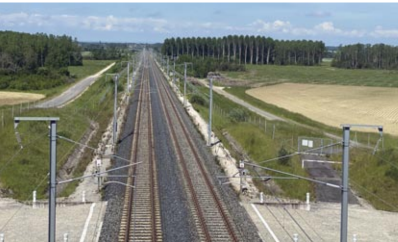
La ferme solaire de Pont-sur-l'Ognon sera implantée le long de la LGV Rhin-Rhône.

Le site de Pont-sur-l'Ognon, ancienne base travaux de la Ligne à Grande Vitesse Rhin-Rhône pendant sa construction, a été retenu comme présentant des caractéristiques favorables à l'élaboration de ce projet.